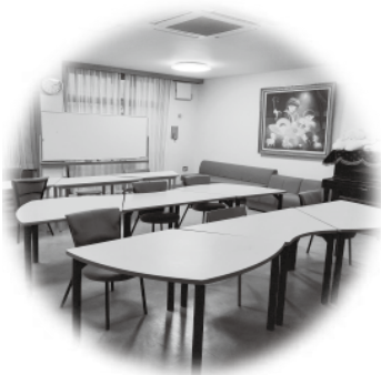
多目的スペース★パティオ

今年度から、更に、新たな取り組みとして、昨年度まで1階と2階に分かれていた分校分教室とてくてくの職員を一体化し通所部門職員として、より責任を持った