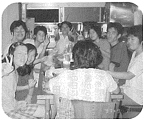
ホームでの食事風景